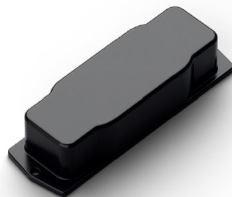
Flangia doppia FLD Color 145x46x32 mm