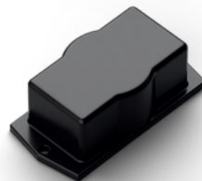
Flangia singola FLS Color 46x93x32 mm