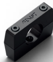
Staffa SF22 Color 53x13x35 mm